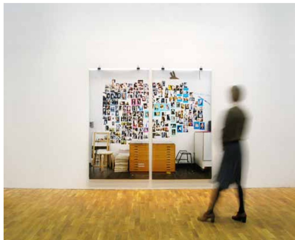
UTSTÄLLNINGSDOKUMENTATION HANINGE KONSTHALL BILDEN VISAR VERKET WORKSHOP 2011, HANINGE KONSTHALL BLÄCKSTRÅLEUTSKRIFT 2 DELAR 110 x 200 cm