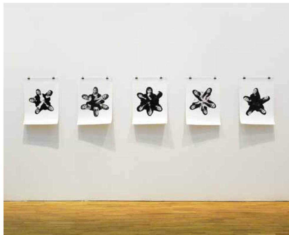
UTSTÄLLNINGSDOKUMENTATION HANINGE KONSTHALL BILDEN VISAR VERKET MED BLICKEN I SPEGELN COLLAGESERIE 5 DELAR, C-PRINT 50 x 70 cm

MR: Fotografiet visar tydligt processen i arbetet samtidigt som den inkluderar rummet och därmed sammanhanget de skapades i. Dessutom är den förstörad till naturlig storlek. Det här är en estetik jag ofta använder mig av när jag gestaltar processen i en workshop. Bilden blir min berättelse om vår gemensamma process. Även här finns referenser till den fotografiska historien och traditionen. Väggbilden blir ett slags minne, ett arkiv över vår process. Jag arbetade mycket med familjealbumet i mina tidiga självporträtt och har återkommit till användningen av bilder som minne och albumet som arkiv. Därför tycker jag att det är intressant att bilder idag sällan blir fysiska och inte sätts in i album som tidigare. Nu befinner vi oss i ett stort generationsskifte där den yngre generationen har ett helt annat förhållningssätt till kameran och digital bild. Det är en spännande brytningstid och den här workshopen är den första som kommer att följas av fler med samma tematik.